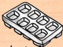
un bac à glaçons